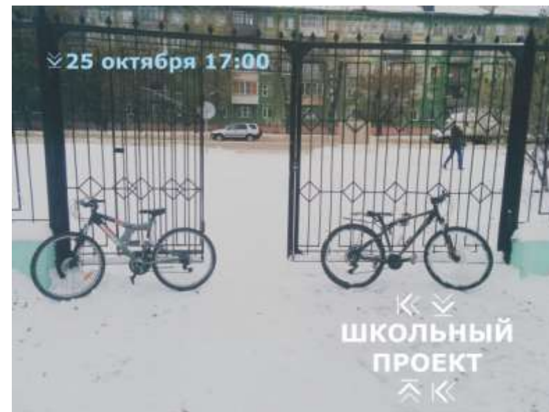
Дети пользуются сейчас